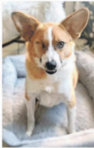
Snickers – trotz Handicap ein lebensfroher Hund.

Letschow/rb. Dem zweijährigen Mischlingsrüden Snickers fehlt ein Auge und ein Beinchen hat er auch verloren. Seiner Lebensfreude steht das jedoch keinesfalls im Wege. Der süße Hundemann will etwas erleben. Egal ob lange Spaziergänge oder baden im See, egal ob Kinder oder Oma, Snickers liebt jede Beschäftigung und jeden Menschen. Gerne würde er in einer netten Familie leben. Allerdings müssten die Gegebenheiten passen, denn Treppensteigen sollte er natürlich nicht regelmäßig. Der liebe Jungspund braucht kein Mitleid, sondern Menschen die einem jungen, unerfahrenen Hund klare Grenzen aufzeigen. Das ist bei ihm auch gar kein Problem. Mit